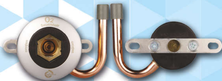
Punkt poboru do paneli