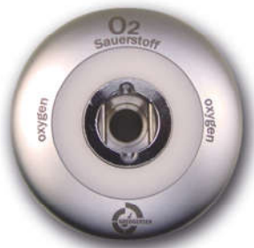
System AGA SS