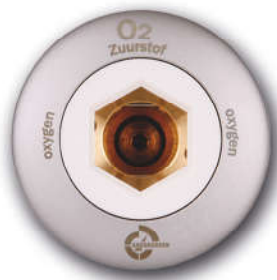
System DIN 13260-2