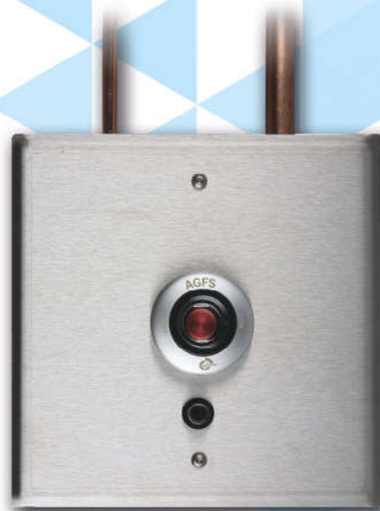
Odciąg gazów poanestycznych