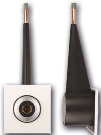
Punkt poboru podtynkowy