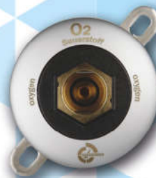
Punkt poboru do kolumn