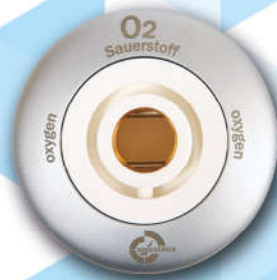
System BS 5682