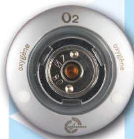
System NF S 90-116